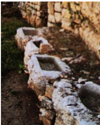
Een kribbe met drinkbakken

Het was ook de lammertijd, vele lammetjes werden geboren en later verhandeld als offerdier voor het aanstaande Pesachfeest. Dit feest begint 14 dagen na de eerste volle maan in de eerste maand (Nissan) van het Joodse jaar. Het is een periode (maart/april) net na de winterregens en voor de droge hitte van de komende zomer.